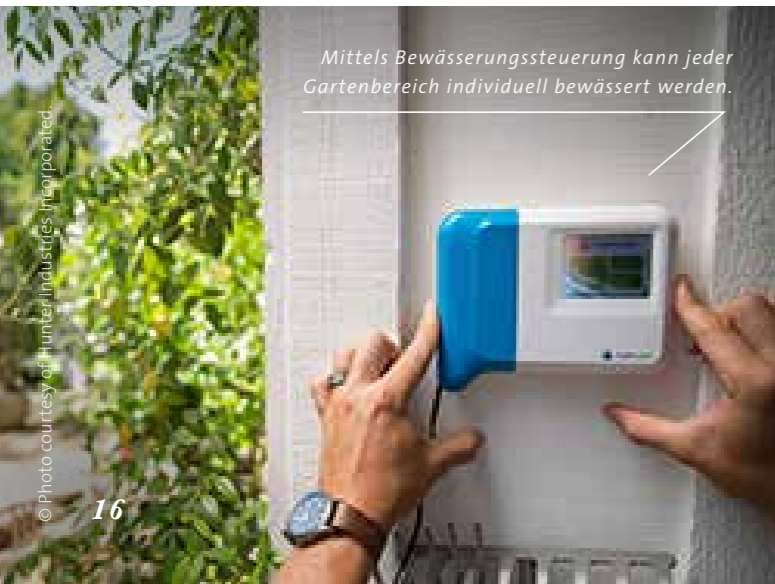
Mittels Bewässerungssteuerung kann jeder Gartenbereich individuell bewässert werden.

https://www.galanet.org/blog/praktisch-und-sparsam-automatische-gartenbewaesserung/