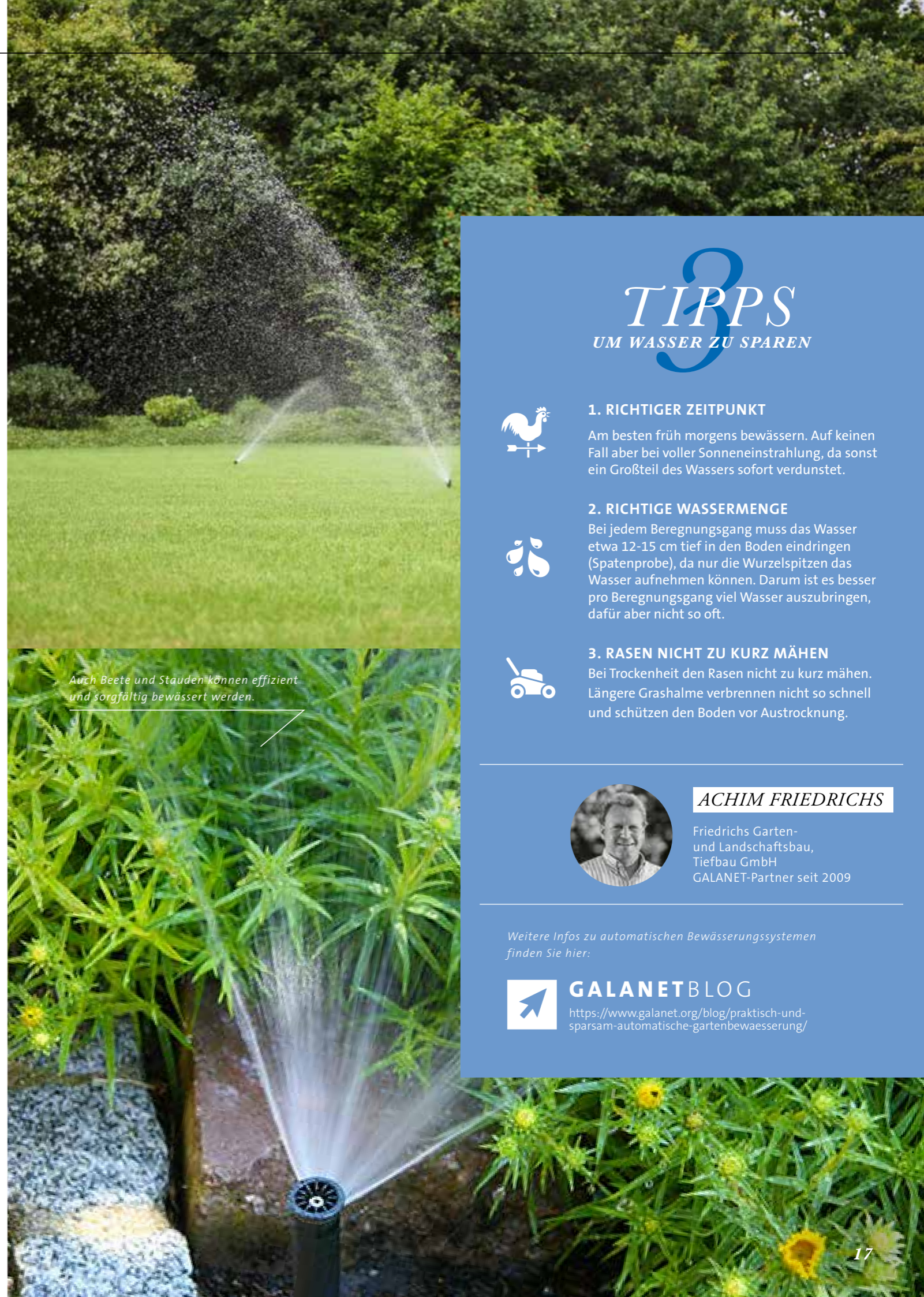
Auch Beete und Stauden können effizient und sorgfältig bewässert werden.

Vegetationsflächen zu bewässern ist sehr zeitaufwendig und kann von Hand niemals so genau und sorgfältig erledigt werden, wie mit einem automatischen System. Durch eine professionelle Planung und einen fachmännischen Einbau der Bewässerungsanlage, werden die unterschiedlich dimensionierten Versenkregner mit Wasser- und Steuerungsleitungen miteinander verbunden. Über die Steuerungstechnik wird dann die Vegetation mit genau so viel Wasser versorgt, wie nötig. Der Rasen dankt es Ihnen mit sattem, gesundem Grün, bei gleichzeitiger Einsparung von wertvollem Wasser.