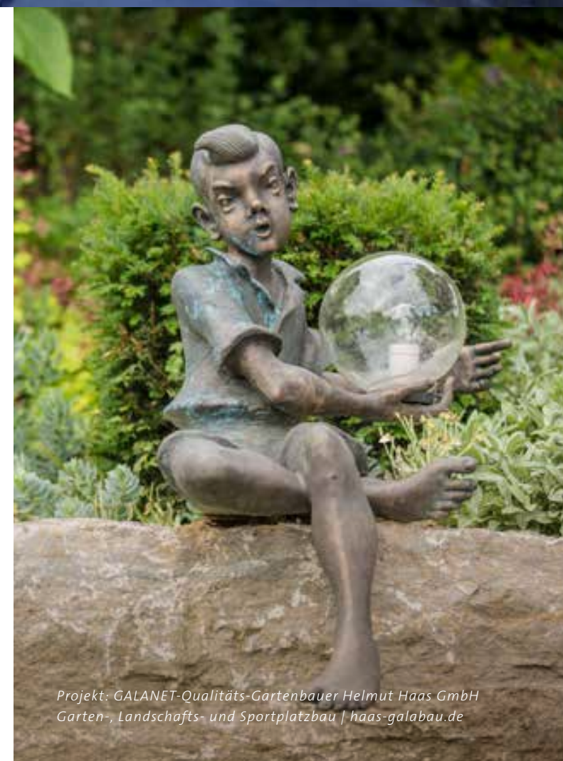
Projekt: GALANET-Qualitäts-Gartenbauer Helmut Haas GmbH Garten-, Landschafts- und Sportplatzbau | haas-galabau.de

Um Ihren Garten auch nach Einbruch der Dunkelheit weiter strahlen zu lassen, muss nicht die gesamte Fläche beleuchtet werden. Perfekt geplant und fachmännisch umgesetzt, tanzen Licht und Schatten leichtfüßig über Grünflächen, Blumenbeete, Terrassen und Wasseroberflächen.