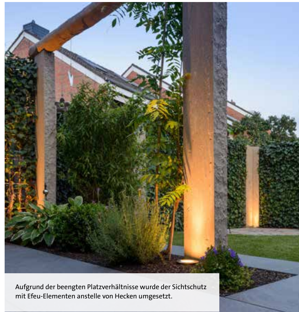
Aufgrund der beengten Platzverhältnisse wurde der Sichtschutz mit Efeu-Elementen anstelle von Hecken umgesetzt.

Falko Werner Garten- und Landschaftsbau GALANET-Partner seit 2005