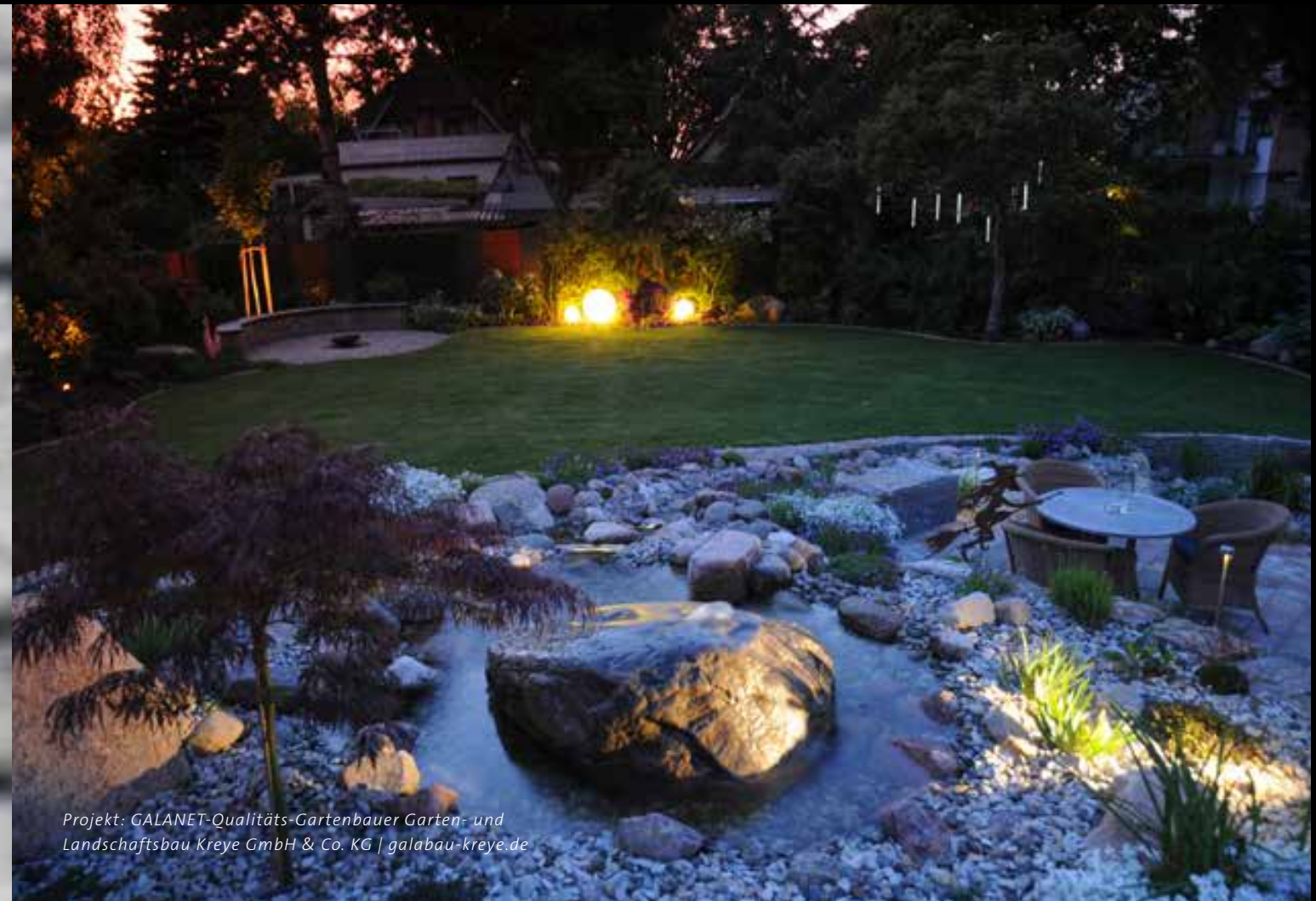
Projekt: GALANET-Qualitäts-Gartenbauer Garten- und Landschaftsbau Kreye GmbH & Co. KG | galabau-kreye.de